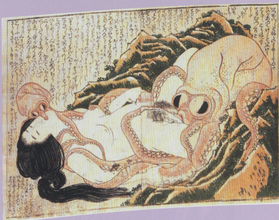
Recht: July , 2002 Boven: How sweet is the space between my legs , 2000–2002