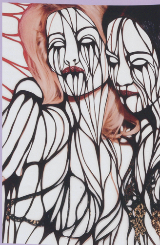
Recht: Art, 2001 (detail)

Haar tweede bezoek aan New York was kort na 9-11, en in dat was in shock. Eigenlijk kon Amie zich toen beter verhouden tot de stad, 'misschien juist omdat de mensen verdrietig en gesoñoriëerd waren,' zegt ze beschroomd. 'Ik paste toe met mijn Amerikaanse vriend me leerde: dat je via via iets voor elkaar kunt